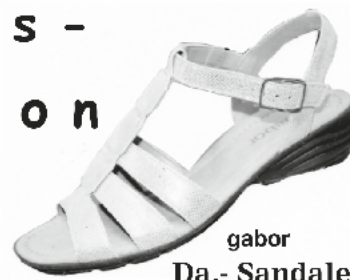
gabor Da.- Sandale ab € 69.90