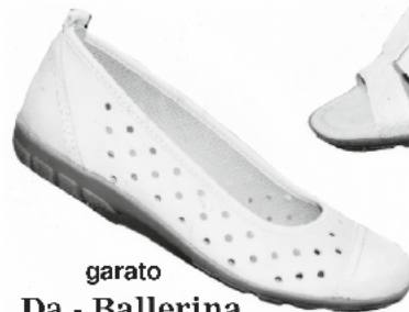
garato Da.- Ballerina ab € 59.90