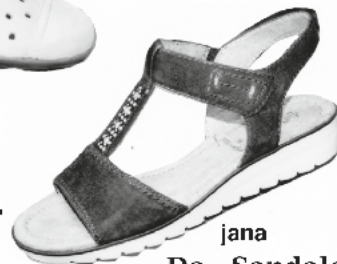
jana Da.- Sandale ab € 59.90