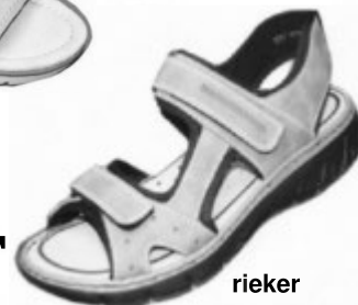
rieker He.-KV Sandale € 49.90