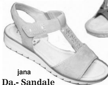
jana Da.- Sandale € 59.90