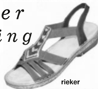
rieker Da.- Sandale € 49.90