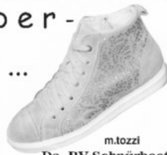
m.tozzi Da.-RV Schnürboots