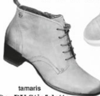
tamaris Da.-RV Stiefelette