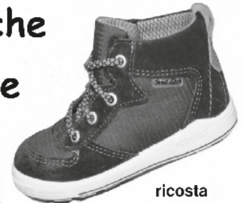
ricosta Ki-Schnürboot /Tex ab Gr.21 € 59.90