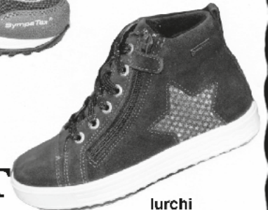
lurchi Mäd-Schnürboot /Tex ab € 74.90