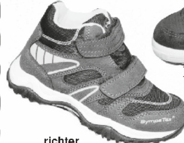
richter Ki-KV Boot /Tex ab Gr.25 € 69.90